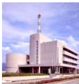
福井市防災センター

また、体験部屋の外で地震が起きたときの模擬体験もしました。大地震では、大きな自動車も大きく揺れ、頑丈なコンクリートの塀がバタンと倒れてきます。そのような危険な物から離れ、頭を守ることを教わりました。