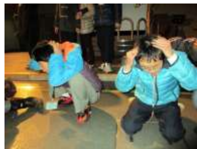
姿勢を低く、頭を守る

地震体験は、模擬教室のような部屋で席に着き、地震の揺れを体感しました。机の下に隠れる練習は学校の避難訓練でやっていて慣れていますが、地面が揺れる経験は初めてです。実際に揺れると勝手が違って戸惑った生徒もいましたが、全員が机の下に入ることができました。