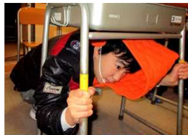
机の下にしっかりもぐって

この他、火事体験では、「煙を吸いこまないよう、ハンカチを口に当て、姿勢を低くして避難すること」を教えていただいたり、台風体験室で、秒速20m以上の風の激しさを体感したりしました。