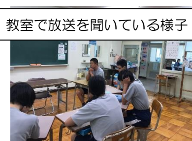
教室で放送を聞いている様子