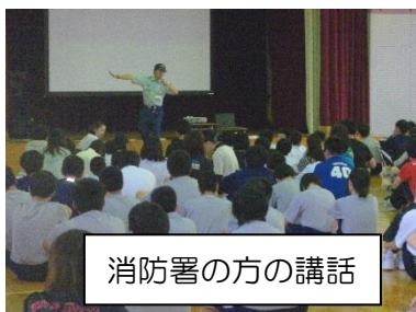
消防署の方の講話