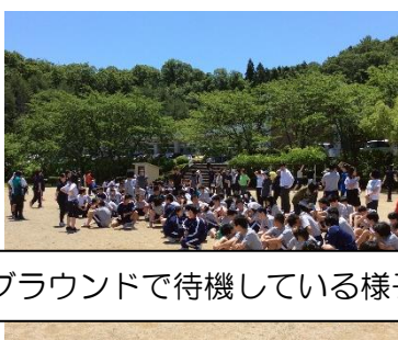
グラウンドで待機している様子