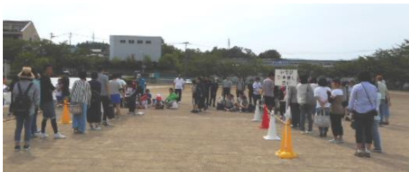
<左が小学部の受付、右が中学部の受付>