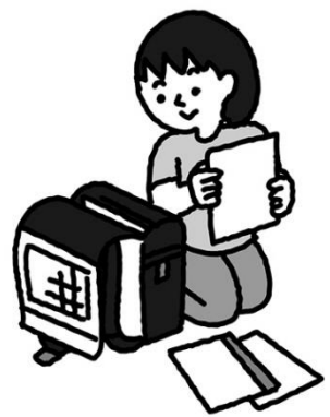
あ さ 朝、バタバタしないよう ま え ひ じ ゆ ん び 前の日に準備しておく