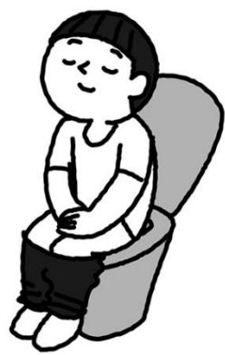
ち ょう し ょ く ご で 朝食後は出なくても べ ん ざ 便座にすわってみる