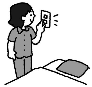
す い み ん じ かん だい じ 睡眠時間は大事 よ る は や ね 夜は早く寝る