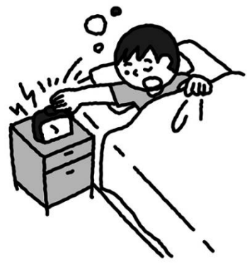
あ さ ぶ ん は や まずは朝 10分早く おきてみる